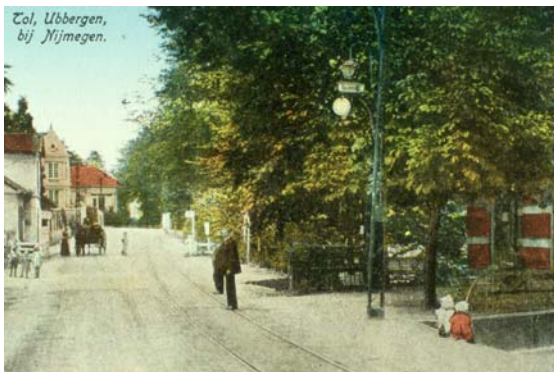
Ubbergen bij de tol

Alle panden aan het Ubbergse deel van de Rijksweg behoren tot het sinds 1993 beschermde dorpsgezicht. Veel van de hoofdzakelijke 19 e -eeuwse villa's die na de ontsluiting van Ubbergen zijn gebouwd, zijn rijksmonumenten.