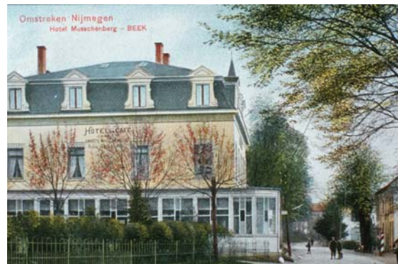
Hoek Keteldal "Groot Musschenberg"