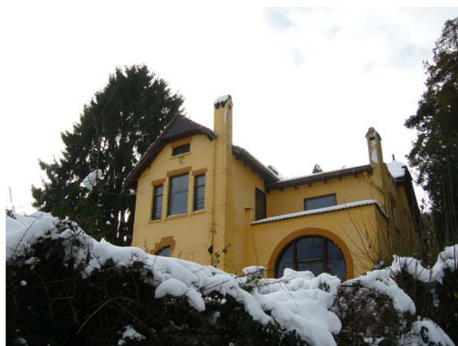
Villa particulier bewoond, a.u.b. op gepaste afstand bezichtigen.

Deze brandde door onoplettendheid van geallieerde troepen af terwijl ze bezig waren er iets te eten klaar te maken. Het pand bestond uit een woongedeelte voor de landgoedbeheerder en zijn gezin, een verblijf voor baron Van Randwijck en eventuele gasten, en een café met terras voor bijvoorbeeld wandelaars. In 1941 was de heerlijkheid Beek (in eigendom van het geslacht der baronnen Van Randwijck) aangekocht door de Stichting Geldersch Landschap. Na de oorlog werd op de plaats van de Ravenberg-Taveerne de woning gebouwd voor de boswachter in dienst van Geldersch Landschap. Architectenbureau G. Feenstra ontwierp het in 1950 in de stijl van de Delftse School. Volgens de architecten van de Delftse School lag schoonheid juist in eenvoud en was een goede harmonie tussen massa, ruimte en lichtval belangrijk. Architectuur moest “nederig” zijn en vooral niet opvallen en er werd veelal gebruik gemaakt van traditionele elementen, zonder dat in een gebouw letterlijk een historische situatie gekopieerd werd. De stijl is vlak voor de tweede wereldoorlog en in de wederopbouwperiode veel toegepast.