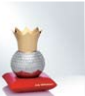
Disco king J-C. de Castelbajac