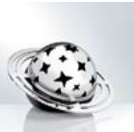
Planète Tous les Trois