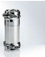
Compression Pascal Morabito