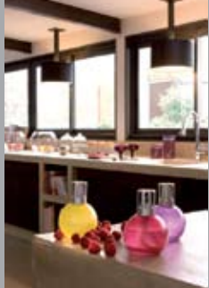
Envie de couleur

Zin in kleur, klassiek, design en etnisch