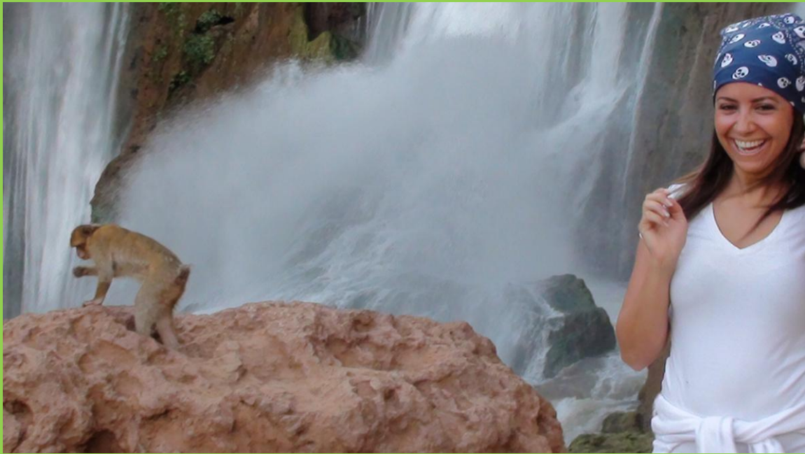
Nabila aux Cascades d'Ouzoud avec les macaques de Barbarie sauvages