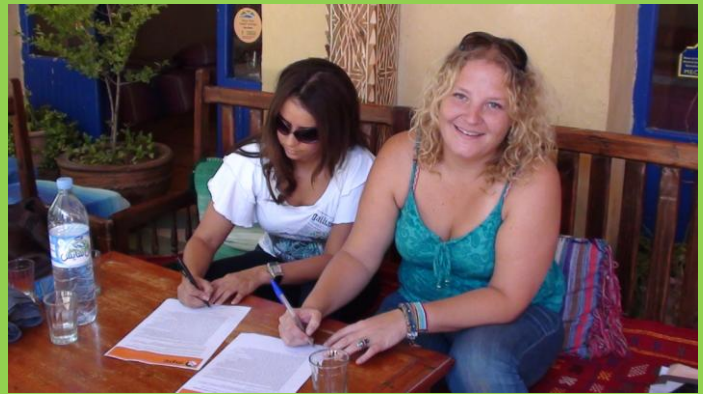
Signant le contrat.....