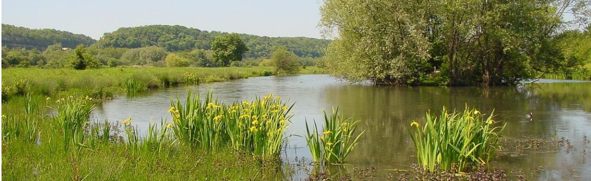
De Eijsder beemden

Dinsdag 19 juni iets heel nieuws. Vandaag brengt de bus ons naar Oost-Maarland, waarvandaan we een rondwandeling maken door de Maasvallei onder Maastricht: de Eijsder beemden. Er komen heel veel vogelsoorten voor, maar ook de vegetatie kent vele planten van de Rode-lijst. De bever bouwt er zijn burchten en voor libellen en andere insecten is het er een paradijs.